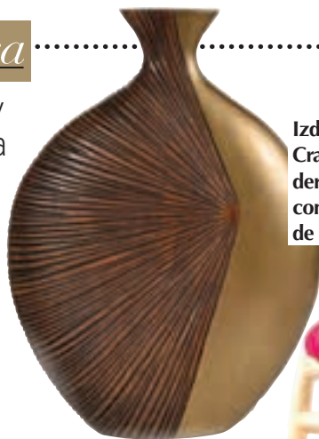
Izda.: jarrón de Crate&Barrel; derecha: silla con bordados, de Folk by Alice.

S úmame al “deco boliviano”, inspirado en el aguayo, un textil típicamente andino, que viene de un origen precolombino y con una enorme influencia cultural en multitud de motivos y diseños actuales. Cada uno de estos textiles tiene una historia que contar que va desde el entramado del tejido, los colores, los hilos y las figuras que aparecen en él. A lo largo de la historia, este tipo de tejido ha impulsado la creatividad de los diseñadores de interiores y de las grandes casas de decoración. Se trata de un estilo infalible que fusiona color, abstracción, tradición y cierto espíritu naïf . Un must .