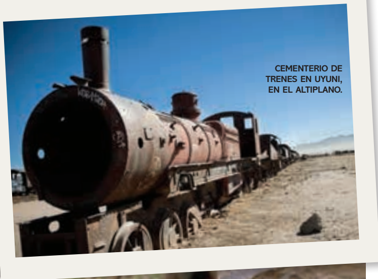
CEMENTERIO DE TRENES EN UYUNI, EN EL ALTIPLANO.